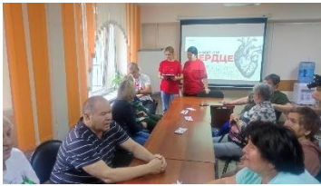
Международный день пожилого человека