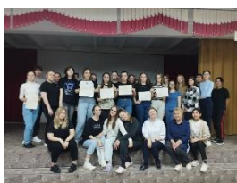
Поговорим о важном