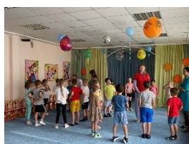
Сердце – символ жизни и здоровья