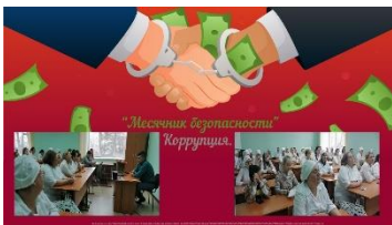
Месячник безопасности. Беседа «Что я должен знать о коррупции?»