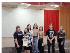
Трезвость – выбор сильных!