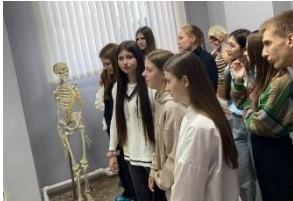
Профориентационная экскурсия для учеников 11 класса средней школы №13